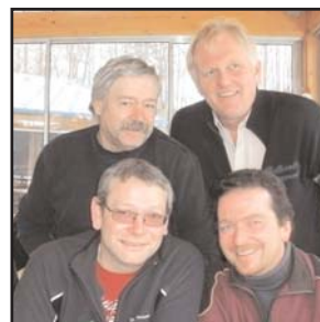
Gott sei Dank konnte noch die Mittagssuppe eingenommen werden. Somit waren wir bereit für Platz 20