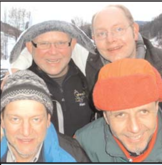
Die Eismänner haben sich gedacht, sie machen schnelle ein Eis auf dem Fischteich auf dem sie gewinnen können. Leider Nicht.

Auch auf der neuen Spielstätte setzte sich Favoritenkönnen durch!