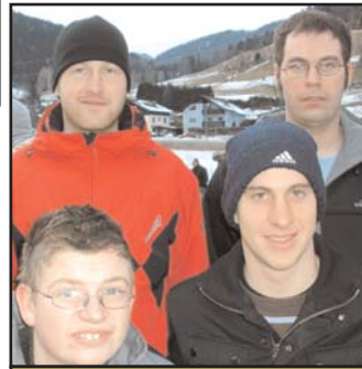
Die Wexler waren heuer das 1. Mal am Start. Sie haben aber vergessen, dass sie noch um Platz 17 kämpfen sollten.