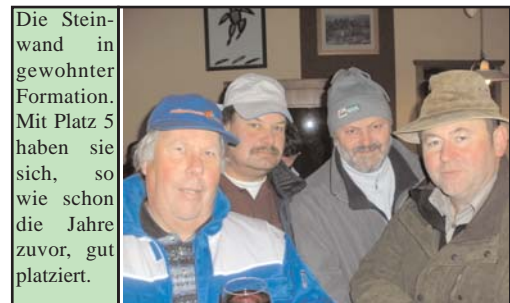
Die Steinwand in gewohnter Formation. Mit Platz 5 haben sie sich, so wie schon die Jahre zuvor, gut platziert.