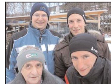
Die Hollis waren heuer gut beinander. Platz 4 - ein super Ergebnis

Der ausgesprochenen Bequemlichkeit der Guzzisten, die auch dafür bekannt sind, dass sie bei schlechtem Wetter keinen Meter mit ihren Guzzis fahren, ist es zu verdanken, dass sich die Teilnehmer des heurigen Guzzi-Turnieres nicht wieder die Finger abfrieren mußten. Obwohl in den letzten Jahren auch der Hofwaldteich würdige Austragungstätte des Turnieres war, fehlte trotzdem die mollige Wärme einer gemütlichen Gastronomie in den Spielpausen. Somit wurde heuer ein schon alter Gedanke aufgegriffen und das Turnier ortsverändert.