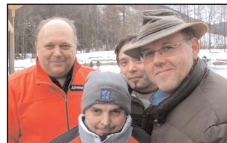
Höfer Deller sind wie immer die Anwärter auf den Sieg. Heuer leider verloren gegen die Wagners