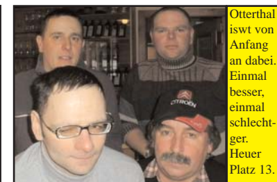
Otterthal iswt von Anfang an dabei. Einmal besser, einmal schlechter. Heuer Platz 13.

Übrigens: den heurigen "Guzzi-Express" gibt es auch auf www.guzzi.at zum Anschauen und download.