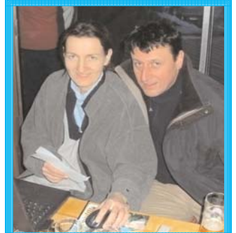
Vroni und Wolferl sorgen für die EDV-Auswertung und für den Druck der Zeitung.