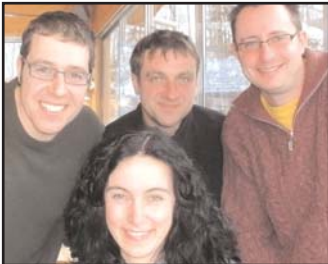
Die Mannschaft der Herzen mußten das eine oder andere mal erst von der Pause geholt werden. Platz 15 - nicht schlecht