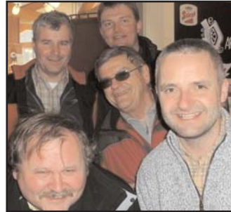
Die Musik wurde heuer durch die steirische Tuba verstärkt. Das brachte ihnen den Platz 12.