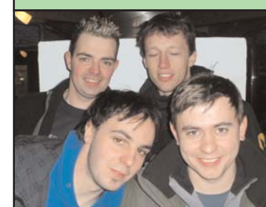
Die Buam haben schon öfters um den Sieg mitgespielt. Platz 3.