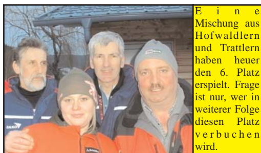
Eine Mischung aus Hofwaldlern und Trattlern haben heuer den 6. Platz erspielt. Frage ist nur, wer in weiterer Folge diesen Platz verbuchen wird.