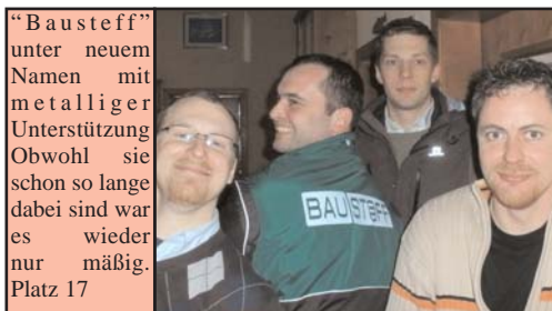
"Bausteff" unter neuem Namen mit metalliger Unterstützung. Obwohl sie schon so lange dabei sind war es wieder nur mäßig. Platz 17