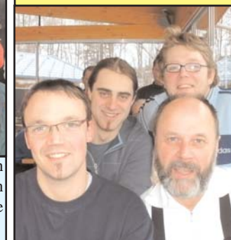
Die Feuerwehr hat uns tatkräftigst mit den Schläuchen unterstützt. Auf quasi "Ihrem Eis" hat sie es auf Platz 14 gebracht.