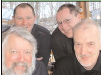
Impressum: Idee, Text und Fotos: für Moto Guzzi. Heisch Rennhofer