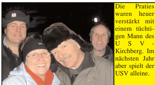
Die Praties waren heuer verstärkt mit einem tüchtigen Mann des USV - Kirchberg. Im nächsten Jahr aber spielt der USV alleine.