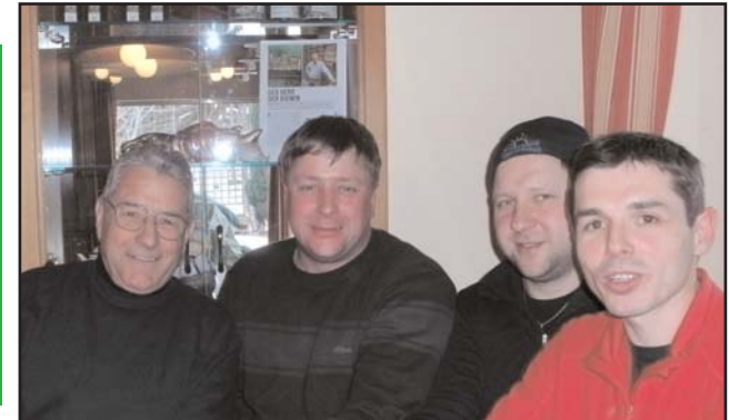
Die Wagners sind immer für den Sieg gut, das wissen wir. Heuer waren sie ohne ihren Mannschaftsführer Nortsch unterwegs. Bravo den Wagners !!

Der ausgesprochenen Bequemlichkeit der Guzzisten, die auch dafür bekannt sind, dass sie bei schlechtem Wetter keinen Meter mit ihren Guzzis fahren, ist es zu verdanken, dass sich die Teilnehmer des heurigen Guzzi-Turnieres nicht wieder die Finger abfrieren mußten. Obwohl in den letzten Jahren auch der Hofwaldteich würdige Austragungstätte des Turnieres war, fehlte trotzdem die mollige Wärme einer gemütlichen Gastronomie in den Spielpausen. Somit wurde heuer ein schon alter Gedanke aufgegriffen und das Turnier ortsverändert.