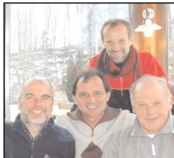
Die Gemeinderäte haben sich enorm gesteigert. Der quasi schon gepachtete letzte Platz wurde heuer nicht erreicht. Platz 19 (Vorletzter)

Übrigens: den heurigen "Guzzi-Express" gibt es auch auf www.guzzi.at zum Anschauen und download.