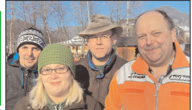
Höfer Deller gehören schon quasi zum Inventar des Turniers. Somit ist mit einem Sieg dieser erfolgreichen Mannschaft immer zu rechnen.