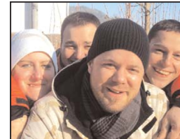
"No Names" mittlerweile eine Mannschaft mit Namen. Platz 10

Und heute schließlich das Moto Guzzi Eisstockturnier, bei dem mit 80 Mann die Belastbarkeit der Hofwaldteich-Eisdecke neuerlich auf die Probe gestellt wurde.