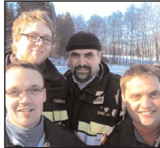
Mit Unterstützung des Kommandanten ging es heuer einmal besser. Platz 8, super.

Die Mannschaft "Bausteff" erreichte den 13. Platz. In der Finalrunde wollten sie gar nicht aufhören zu spielen.