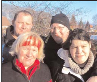
Die "Brauns" hielten sich heuer sehr tapfer. Mit Platz 16. haben sie Witterung in Richtung "Top Ten" aufgenommen.

Impressum: Moto Guzzi Idee, Fotos, Inhalt und Text: Heischi Rennhofer