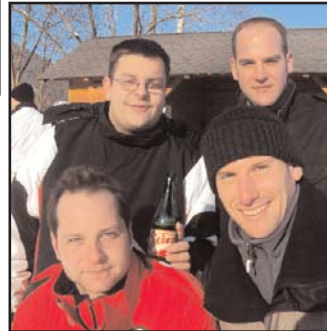
Die Pinguine, anfangs ein Fressen für alle waren sie heute ihrem Namen gerecht. Platz 17 ist ziemlich weit hinten.